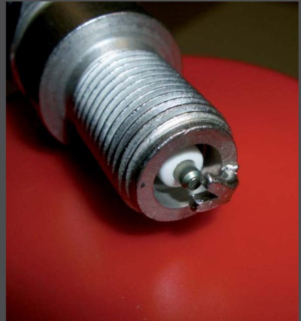
SplitFire - Standard mit V- Elektrode

SplitFire - Standard mit V- Elektrode SplitFire - Triple Platinum